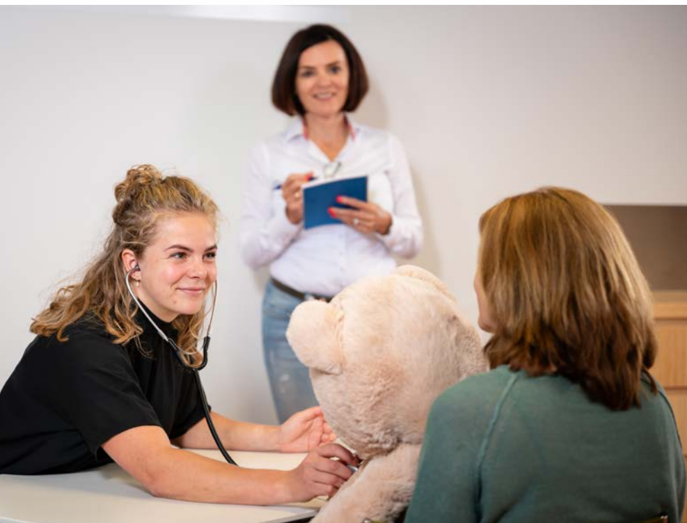
Aios arts VG