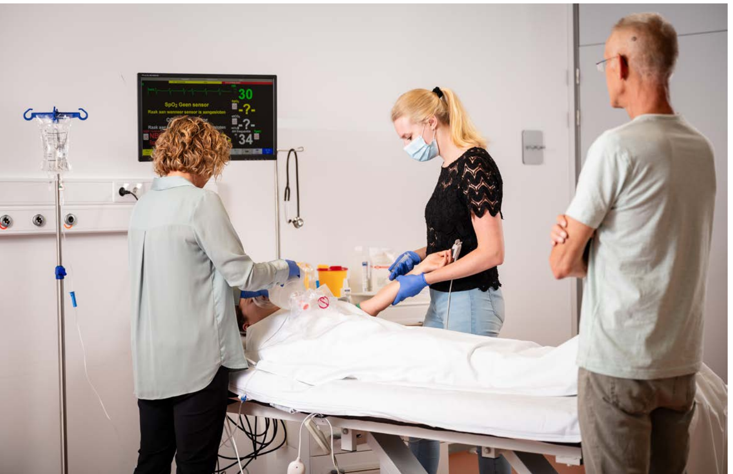
Aios donorarts (foto: SBOH).

Het blijft urgent om het aanhoudende tekort aan artsen binnen de sociale geneeskunde en eerste lijn aan te pakken. De tekorten blijven toenemen en zullen niet op korte termijn zijn opgelost. Dit project heeft een positieve ontwikkeling in gang gezet waarbij het extramurale geneeskundige domein is versterkt en onderlinge samenwerking is bevorderd. Deze verbinding draagt bij aan het gezamenlijk en integraal aanpakken van de tekorten aan extramuraal werkzame geneeskundigen.